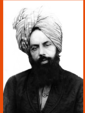
Hadhrat Mirza Ghulam Ahmad AS , der Verheißene Messias und Imam Mahdi des Islam

In der heutigen religiösen Welt spielt die Ahmadiyya Muslim Jamaat eine einzigartige Rolle. Glaube und Vernunft sowie die Lehre, dass zwischen Religion und Wissenschaft kein Widerspruch bestehen darf, sind integraler Bestandteil der Lehren der Ahmadiyya Muslim Jamaat. Diese islamische Reformgemeinde wurde 1889 von Hadhrat Mirza Ghulam Ahmad AS (1835-1908) aus Qadian/Indien gegründet. Er beanspruchte aufgrund göttlicher Offenbarungen der von allen Religionen für die Endzeit angekündigte Reformen und Prophet zu sein, insbesondere der vom Heiligen Propheten Muhammad SAW prophezeite Imam Mahdi, der auch die Wiederkunft von Jesusas repräsentiert. Die Ahmadiyya Muslim Jamaat ist die einzige Gemeinschaft im Islam, die mittlerweile seit mehr als 100 Jahren durch ein spirituelles Khilafat (Kalifentum) geleitet wird. Deziert setzt sich die Gemeinde für die Trennung von Politik und Religion ein. Das jeweilige Oberhaupt heißt Khalifatul Masih, d.h. Nachfolger des Verheißenen Messias AS . Er wird demokratisch durch ein Wahlkomitee der Gemeinde auf Lebenszeit gewählt.