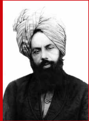
Hadhrat Mirza Ghulam Ahmad as , der Verheißene Messias und Imam Mahdi des Islam

In der heutigen religiösen Welt spielt die AMJ eine einzigartige Rolle. Glaube und Vernunft sowie die Lehre, dass zwischen Religion und Wissenschaft kein Widerspruch bestehen darf, sind integraler Bestandteil der Lehren der AMJ. Diese islamische Reformgemeinde wurde 1889 von Hadhrat Mirza Ghulam Ahmad as (1835-1908) aus Qadian/Indien gegründet. Er beanspruchte aufgrund göttlicher Offenbarungen der von allen Religionen für die Endzeit angekündigte Reform und Prophet zu sein, insbesondere der vom Heiligen Propheten Muhammad saw prophezeite Imam Mahdi, der auch die Wiederkunft von Jesus as repräsentiert. Die AMJ ist die einzige Gemeinschaft im Islam, die mittlerweile seit mehr als 100 Jahren durch ein spirituelles Khilafat (Kalifentum) geleitet wird. Dezidiert setzt sich die Gemeinde für die Trennung von Politik und Religion ein. Das jeweilige Oberhaupt heißt Khalifatul Masih, d.h. Nachfolger des Verheißenen Messias as . Er wird demokratisch durch ein Wahlkomitee der Gemeinde auf Lebenszeit gewählt.