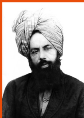
Hadhrat Mirza Ghulam Ahmad AS , der Verheißene Messias und Imam Mahdi des Islam

In der heutigen religiösen Welt spielt die Ahmadiyya Muslim Jamaat eine einzigartige Rolle. Glaube und Vernunft sowie die Lehre, dass zwischen Religion und Wissenschaft kein Widerspruch bestehen darf, sind integraler Bestandteil der Lehren der Ahmadiyya Muslim Jamaat. Diese islamische Reformgemeinde wurde 1889 von Hadhrat Mirza Ghulam Ahmad AS (1835-1908) aus Qadian/Indien gegründet. Er beanspruchte aufgrund göttlicher Offenbarungen der von allen Religionen für die Endzeit angekündigte Reform und Prophet zu sein, insbesondere der vom Heiligen Propheten Muhammad SAW prophezeite Imam Mahdi, der auch die Wiederkunft von Jesusas repräsentiert. Die Ahmadiyya Muslim Jamaat ist die einzige Gemeinschaft im Islam, die mittlerweile seit mehr als 100 Jahren durch ein spirituelles Khilafat (Kalifentum) geleitet wird. Deziert setzt sich die Gemeinde für die Trennung von Politik und Religion ein. Das jeweilige Oberhaupt heißt Khalifatul Masih, d.h. Nachfolger des Verheißenen Messias AS . Er wird demokratisch durch ein Wahlkomitee der Gemeinde auf Lebenszeit gewählt.